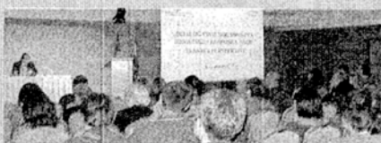
Konferenciji su se odazvali predstavnici brojnih udruga

Predstojnik Ureda za udruge Vlade RH Igor Vidačak iznio je inicijativu za osnivanje Ureda hrvatskih udruga u Bruxellesu te za osnivanje gospodarsko-socijalnog foruma. »Namjera nam je potaknuti stvaranje tijela koje će, uz tradicionalni socijalni,