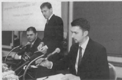
DEGERT Na predstavljanju je bio i Vincent Degert, šef misije EK u Hrvatskoj

Hrvatska je prva nečlanica EU uključena u taj program kojim se potiče sudjelovanje građana u integracijama