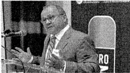
DIREKTOR USAID-a u Hrvatskoj, William Jeffers, jučer na Konferenciji

Ovom konferencijom završava i 14-godišnji rad USAID-a na pružanju potpore razvoju civilnog društva u Hrvatskoj. "Hrvatsko civilno društvo sada je dovoljno snažno da se samostalno razvija i raste", kazao je u uvodnom govoru direktor misije